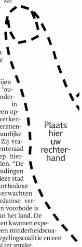
Plaats hier uw rechterhand