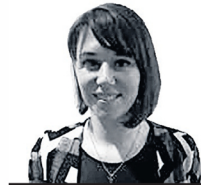
Bedrijven kiezen er vaak ook heel bewust voor om zaken intern op te lossen

Affairezaken liggen heel gevoelig. Privédetective Blok zegt altijd af te wegen of een onderzoek gerechtvaardigd is.